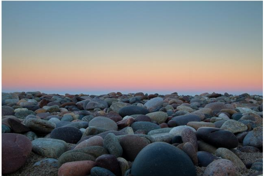
Stonehaven beach at sunset, Kincardineshire, Scotland

Stenen zijn ook fantastisch om wijze spreuken op te schilderen, zodat je ze altijd in 't zicht hebt.